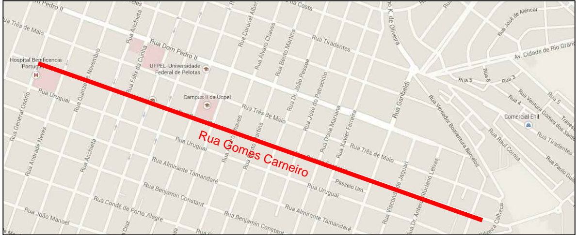
PLANTA LOCALIZAÇÃO S/ESC